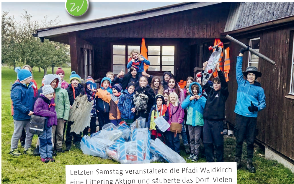
Letzten Samstag veranstaltete die Pfadi Waldkirch eine Littering-Aktion und säuberte das Dorf. Vielen Dank allen für die Unterstützung!

Einmal mehr durften wir auf viele Päckli, Spenden und helfende Hände zählen. Herzlichen Dank!