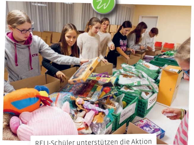
RELI-Schüler unterstützen die Aktion Weihnachtspäckli.