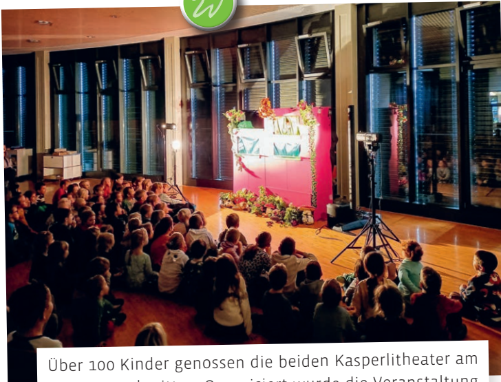
Über 100 Kinder genossen die beiden Kasperltheater am Sonntagnachmittag. Organisiert wurde die Veranstaltung vom Familientreff Waldkirch.