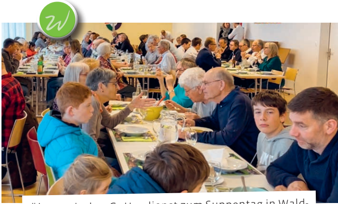
Ökumenischer Gottesdienst zum Suppentag in Waldkirch. Vielen Dank für die Spenden zugunsten von Strassenkindern in Rio de Janeiro, Brasilien.