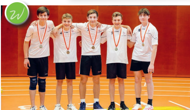
Minifinalturnier U16 Knaben, Athletikzentrum St.Gallen Unsere Waldkircher Volleyballer belegten den sensationellen 3. Rang. Herzliche Gratulation.