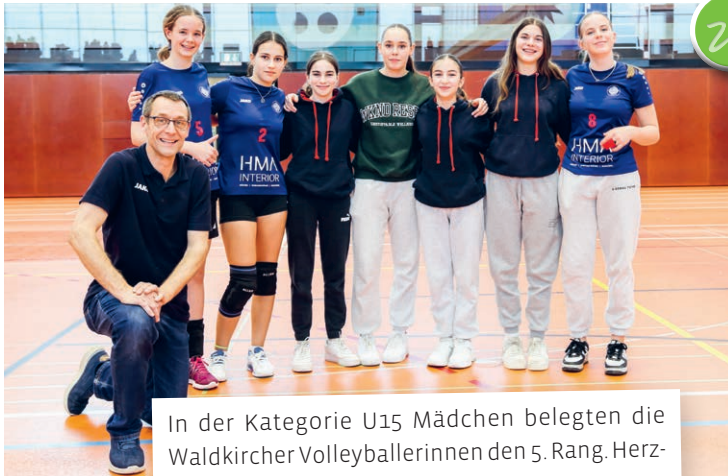
In der Kategorie U15 Mädchen belegten die Waldkircher Volleyballerinnen den 5. Rang. Herzliche Gratulation.