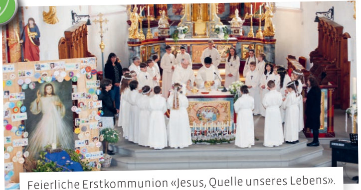
Feierliche Erstkommunion «Jesus, Quelle unseres Lebens».