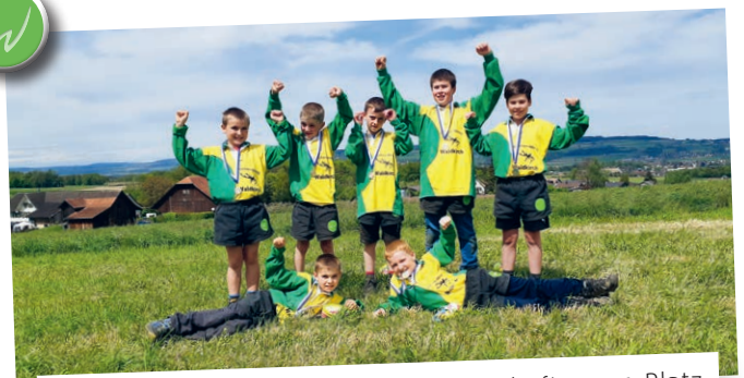
Herzliche Gratulation der OSM-Mannschaft zum 1. Platz und den Schülern zum 3. Platz.